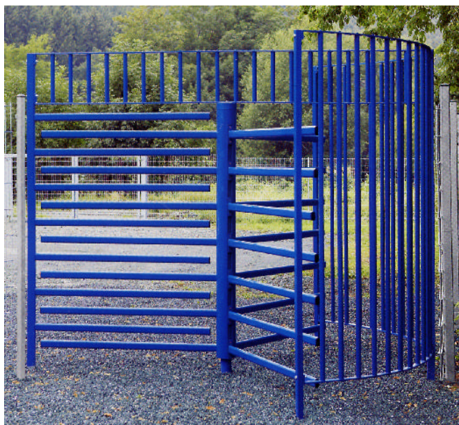
Modèle : DK4 simple avec filtre d'arrêt + grille d'arrêt et option peinture