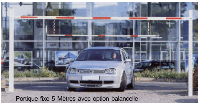
Portique fixe 5 Mètres avec option balancelle