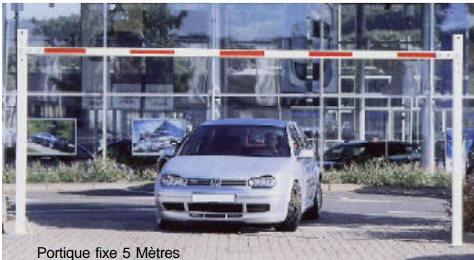
Portique fixe 5 Mètres