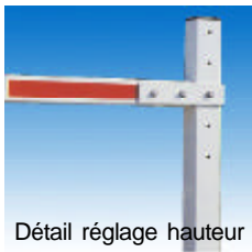
Détail réglage hauteur