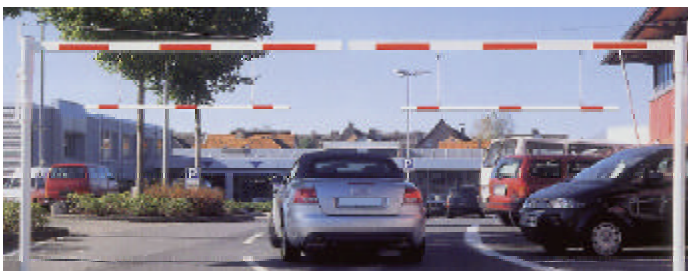
Portique pivotant avec option balancelles